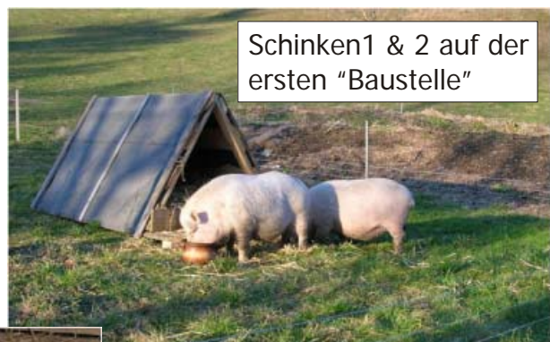
Schinken1 & 2 auf der ersten "Baustelle"