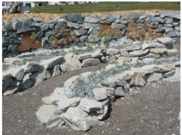
Bild: Trockenmauer mit integriertem Insektenhotel April 2006 Rohr/Burgenland

Mehrere Projekte Trockenmauern und Insektenhotels Österreich 2004- 2007