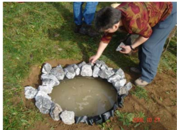
Stellvertretend der "One-hour-pond" und Lehmschlagen in Börlas/Allgäu Oktober 2006