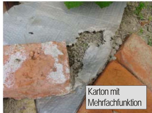
Karton mit Mehrfachfunktion