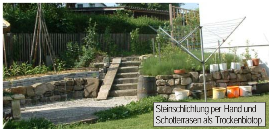
Steinschichtung per Hand und Schotterrasen als Trockenbiotop

Verschiedene Ansichten und Projekte meines Gartens