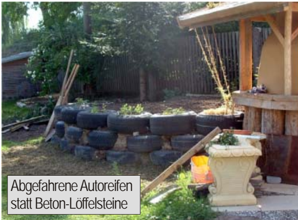
Abgefahrene Autoreifen statt Beton-Löffelsteine