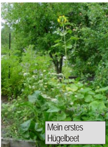
Mein erstes Hügelbeet

Verschiedene Ansichten und Projekte meines Gartens