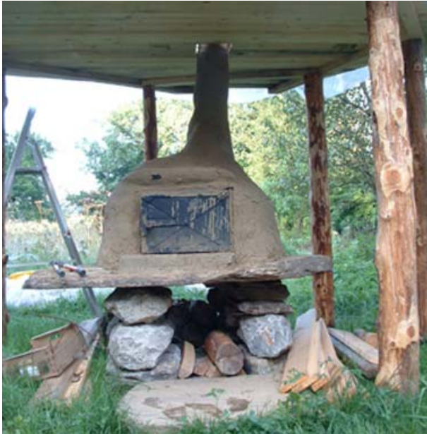
11 Lehmbacköfen A/D/HR 2004-2007