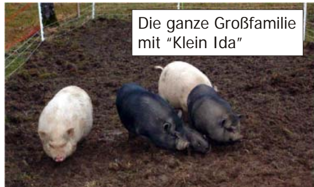
Die ganze Großfamilie mit "Klein Ida"