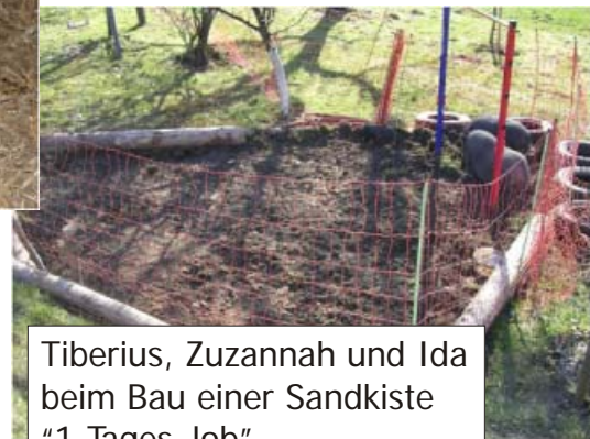
Tiberius, Zuzannah und Ida beim Bau einer Sandkiste "1-Tages-Job"

Die Rasse der Schweine ist mir unbekannt.