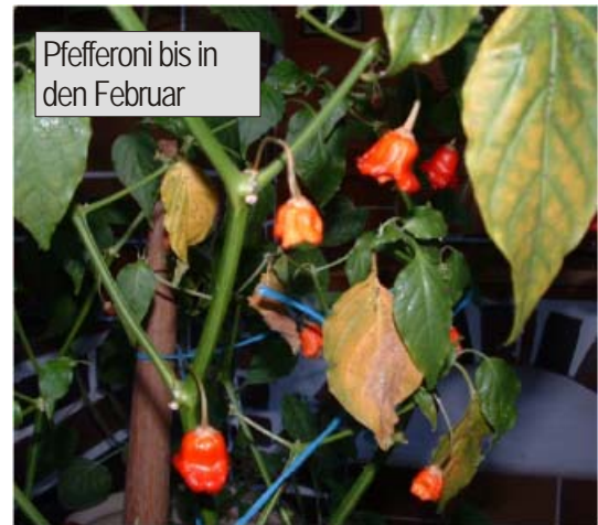
Pfefferoni bis in den Februar