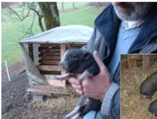
Nachwuchs "Ida" kl. Bild mit verstorbener Schwester