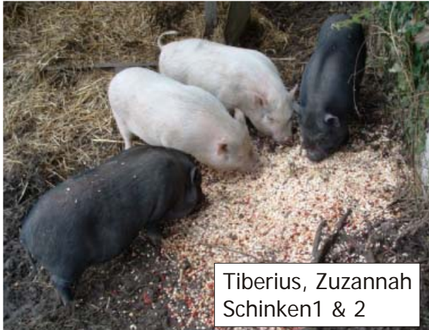
Tiberius, Zuzannah Schinken1 & 2

Die Schweineherde habe ich bei einem Bauern in der Nähe eingestellt.